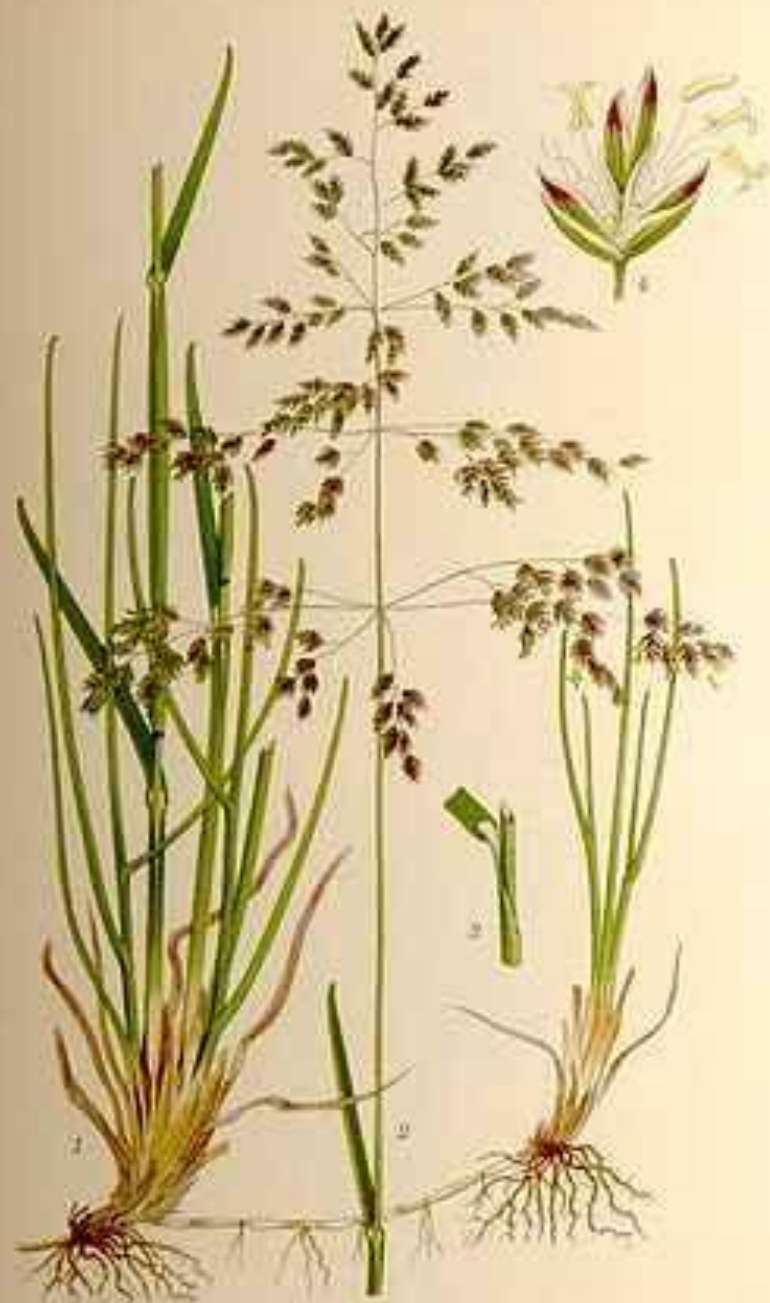
ÅNGSGRÖE, POA PRATENSIS L.